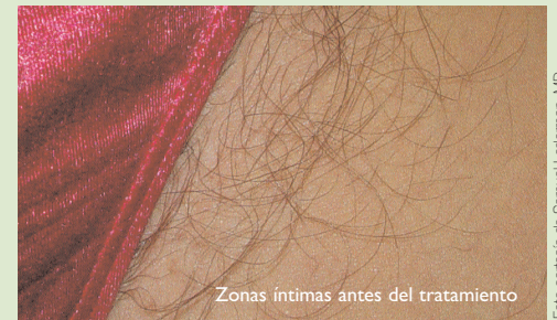
Zonas íntimas antes del tratamiento