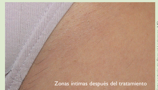
Zonas íntimas después del tratamiento