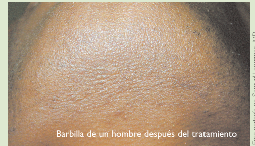
Barbilla de un hombre después del tratamiento