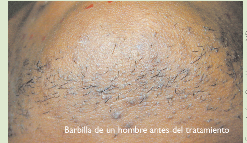
Barbilla de un hombre antes del tratamiento

Gracias a la utilización de la tecnología más avanzada de depilación con láser, el láser CoolGlide permite tratar amplias zonas de piel en el mínimo tiempo y sin las restricciones que imponían las tecnologías anteriores. La mayor longitud de onda del láser CoolGlide ofrece ahora la posibilidad de tratar, con seguridad y eficacia, todo tipo de pieles: claras, oscuras e incluso bronceadas. A diferencia de los otros sistemas, el láser CoolGlide permite eliminar permanentemente los pelos del labio superior en las mujeres con la misma facilidad y eficacia que los gruesos y molestos pelos de la espalda en los hombres. La pieza de mano refrigerada aumenta el confort del paciente y reduce las reacciones cutáneas adversas que se observan a menudo tras el tratamiento con otros sistemas láser.